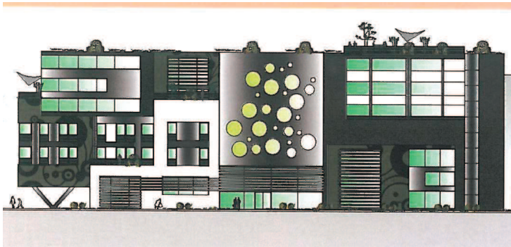
So sieht die Skizze der modernen Siedlung „Goldenes Tor“ aus.

Dem Nebeneinander von privatem Wohnraum und öffentlichem Gewerbe wird mit großräumigen Grünflächen, die die beiden Teile verbinden, Rechnung getragen. Anfang 2016 hofft man mit der Errichtung beginnen zu können.